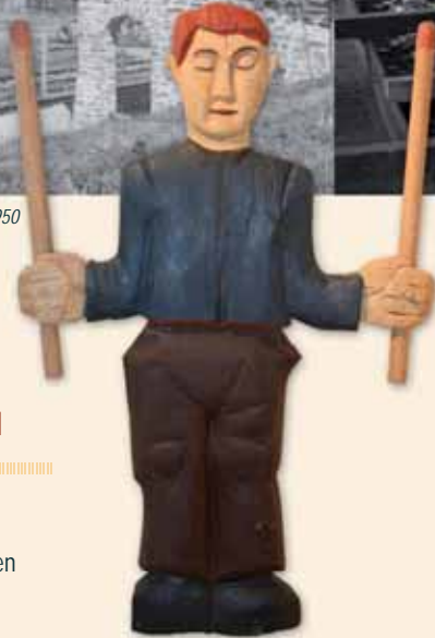
Zündholzmann, der einst den „Allemann“-Maibaum bekrönte, Schnitzarbeit, um 1940

Das Zündholz entwickelte sich im Laufe des 19. und 20. Jahrhunderts zum billigen Massenprodukt und unverzichtbaren Alltagsgegenstand. Im Bayerischen Wald entstand ein Schwerpunkt der Produktion.