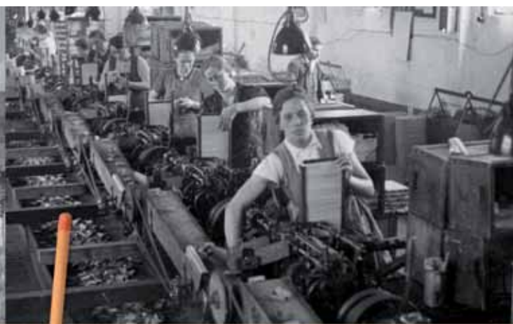
Frauen am Fließband, um 1940 | Ženy u výrobní linky, kolem r. 1940