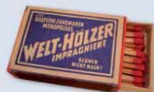
Die Zündholzschachtel des 20. Jahrhunderts: „Welthölzer“ Krabička na zápalky 20. století: „Welthölzer“