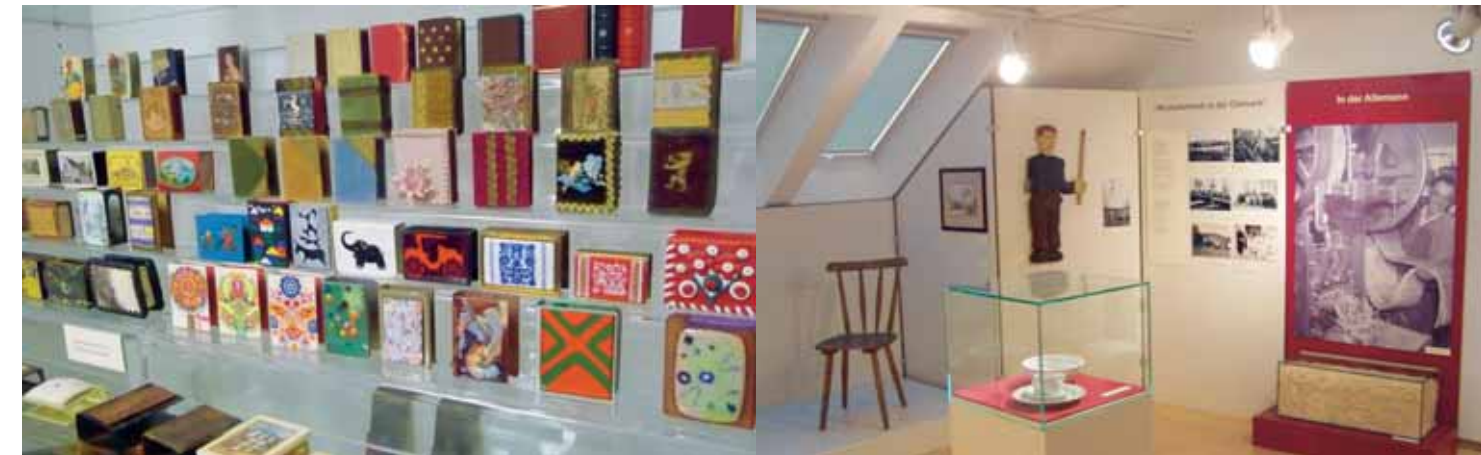
Schmuckbehälter für Zündholzschachteln | Ozdobný zásobník na krabičky od zápalek