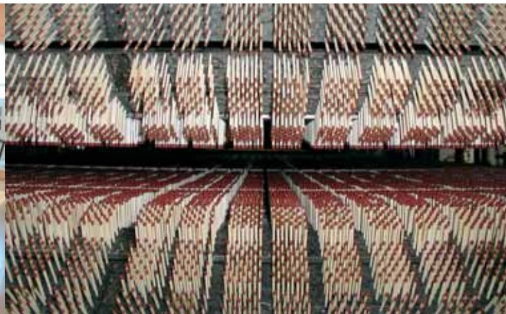
Industrielle Massenware Zündholz / Zápalka jako produkt hromadné průmyslové výroby