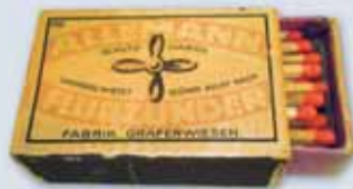
„Allemann“-Zündholzschachtel, um 1940 Krabicka na zápalky, kolem r. 1940

Die Zündholzfabrik Allemann in Grafenwiesen wurde wichtigster industrieller Arbeitgeber der Region, sie bot in den 1950er Jahren rund 350 Menschen Arbeit, mußte 1986 aber schließen.