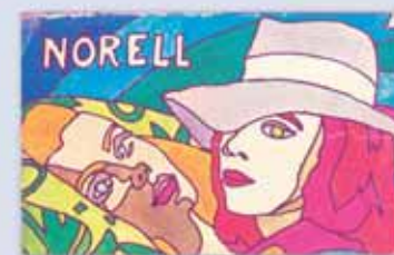
Aus aller Welt: Zündholzschachteln und Etiketten Z celého světa: krabičky a etikety na zápalky

Na ploše o velikosti zhruba 100 metrů čtverečních vykresluje muzeum zápalek vývoj od malovýroby k průmyslové výrobě a přibližuje historické vazby k sousedním Čechám.