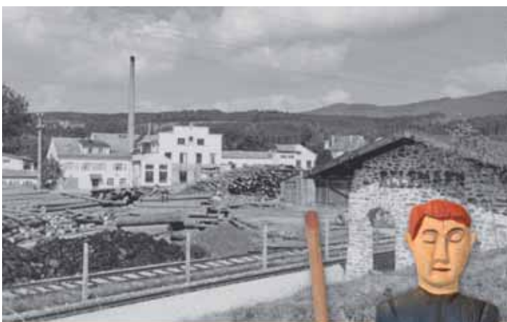
Fabrik mit eigener Bahnstation, Grafenwiesen um 1950 Továrna s vlastní železniční stanicí, kolem r. 1950