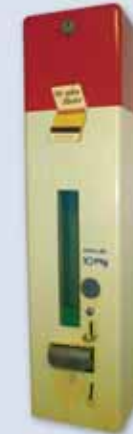
Zündholzautomat um 1968 | Automat na zápalky, kolem r. 1968

Velikonoce až konec října středa, čtvrtek, nedele 14 – 16 h jakož i na požádání; průvodce pro skupiny po telefonické domluvě