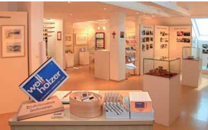
Wechselnde Präsentationen | Obměňující se prezentace