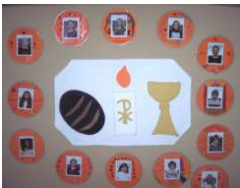
Erstkommunion am 16. Mai 2010