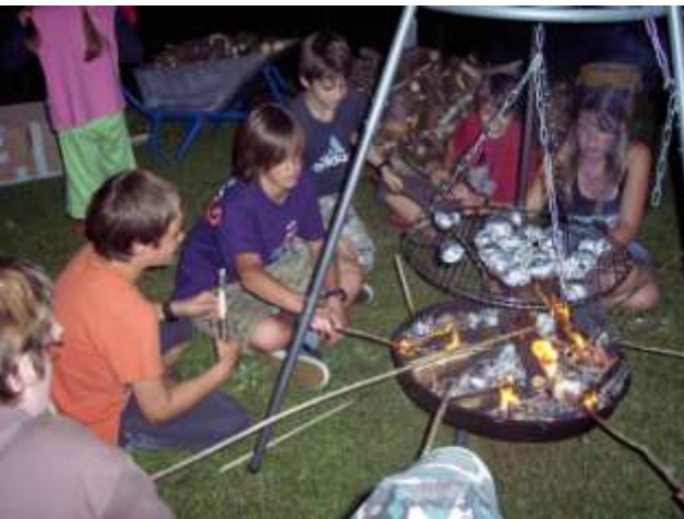
Jugendmaßnahme 2009 auf dem Sportplatz SV Grafenwiesen

Am Wochenende ist in unserer Gemeinde wieder Kirchweih. Nach altem Brauch wird am Vorabend des Kirtasonntags das Dorf aufgeräumt. Dieser Brauch ist ein Bestandteil unserer Dorfgemeinschaft, vor allem für unsere Jugendlichen, die an diesem Abend bzw. dieser Nacht das Dorf aufräumen und die gesammelten Gegenstände um den Kirtabaum aufstellen. Der Brauch des „Kirtastandzusammenbringens“ soll sich aber in vernünftigen Grenzen halten und nicht ins Uferlose ausarten. Beispielsweise könnten Mistbock und Schubkarren, sofern sie draußen frei herumstehen zusammengetragen werden, jedoch nicht Baustellenabsicherungen, Gartenmöbel, Blumenkästen und -töpfe, Kin-