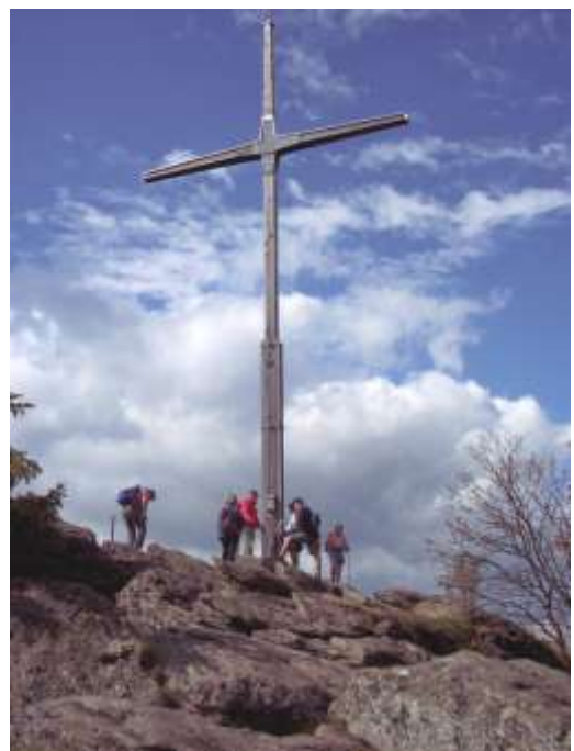
Wanderung mit dem Bürgermeister und Pater Paul zur Kötztlinger Hütte über Kreuzfelsen

An dieser Stelle möchte ich mich recht herzlich bei allen Jugendlichen bedanken, die unsere Dorfgemeinschaft unterstützen und mithelfen. Viele kleine und große Aufgaben werden in den Vereinen durch unsere Jugendlichen übernommen. Ich hoffe auch in Zukunft auf Eure Mitarbeit und Unterstützung.